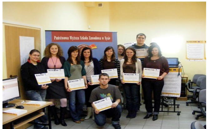
Studenci PWSZ w Nysie biorący udział w fazie testowej projektu RESELTAM

Wszyscy zainteresowani mogą sprawdzić jak wygląda i działa system, odwiedzając stronę www.reseltam.eu .