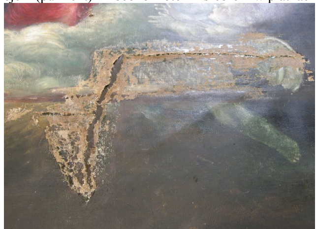
Fot. 3: Rozdarcie płótna głównego obrazu po oczyszczeniu i wyprostowaniu deformacji.

GORZEJ przedstawiała się sytuacja z elementami złoconymi. Zaprawy były bardzo spękane i odspojone, prawdopodobnie na skutek dużych wahań wilgotności, co powodowało ich okresowe pęcznienie i wysychanie. Zdecydowano się je usunąć, wobec czego wszystkie elementy należało powtórnie pokryć kilkoma warstwami zaprawy i ponownie wyszlifować. Tak przygotowaną powierzchnię pokrywano specjalną gliną zmieszaną z klejem (pulment) i złocono złotem i srebrem w płatkach.