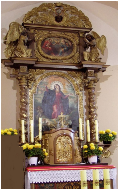
Fot. 1: Ołtarz przed konserwacją ze zdemontowanymi uszakami

Centrum Badawczo-Edukacyjne Konserwacji Zabytków PWSZ zakończyło realizację prac konserwatorskich i restauratorskich przy ołtarzu głównym w kościele p.w. Wniebowzięcia NMP w Kępnicy. Prace prowadzone były od początku kwietnia 2009 roku a montaż końcowy wykonano 7 listopada.