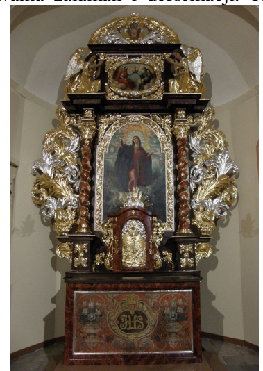
Fot. 4: Ołtarz po konserwacji.

Dzięki żmudnej pracy ołtarz udało się uratować, a rekonstrukcja złoconych powierzchni oraz odsłonięcie oryginalnych marmoryzacji przywróciła mu pierwotny blask i wrażenie bogactwa.