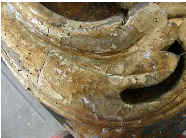
Fot. 2: Stan zachowania powierzchni złoconych elementów po usunięciu złotolu

Był to moment krytyczny dla przyszłości ołtarza. Do pracowni zwieziono elementy trzymające się jedynie na zaprawach lub siłą przyzwyczajenia. Spowodowało to konieczność usunięcia od odwrocia elementów dużych ilości spróchniałego drewna, przesycańca pozostałego,